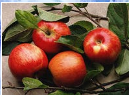
турында хәбәр итә.

Ашарга утырган вакытыгызда, ин элек кулларыгызны юыгыз вә яхшы сөртөгез. Үзегездән олы кешеләр булганда, өстәл янына алардан элек утырмагыз. Аш янында берни белән дә уйнамагыз. Аш янында борыныгызны тартмагыз, чөмереп ашамагыз. Ризыкны зур-зур алмагыз, ашыкмагыз, яхшы чәйнәгез, кул вә киёмнәрегезне буямагыз, башкаларның ашавына карап тормагыз, күп ашарга гадәтләнмәгез, аштан күңелегез кайтканчы туктагыз. Бу нәрсәләрнең сәламәтлек өчен файдасы күп икәнлеген үзегез дә белерсез. Чәй янында каймак вә майлы ашлар булса, киёмнәрегезгә тамызмагыз, кулларыгызны майламагыз, майлы кулларыгызны киёмнәрегезгә сөртмәгез. Аштан соң кул вә авызларыгызны юыгыз, теш арасында бернәрсә калдырмагыз.